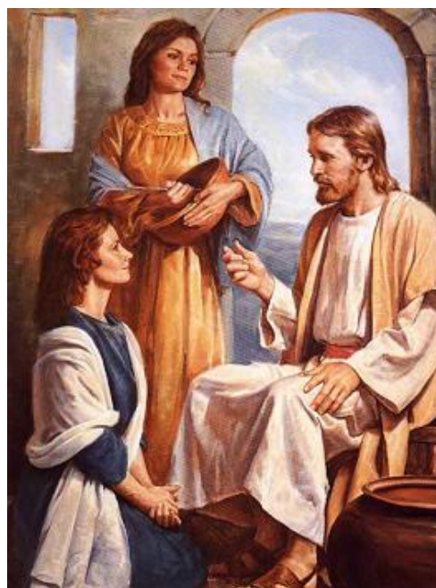
Gesù con Marta e Maria

Tuttavia, Gesù non pensava al ruolo delle donne in termini così ristretti, non