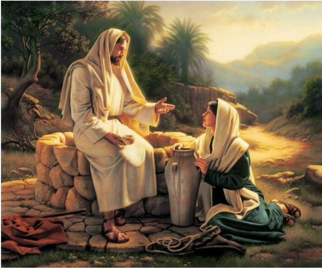
Gesù e la Samaritana

Proprio come quando Gesù si è rivelato a Marta e Maria durante la resurrezione di Lazzaro, Gesù si rivela qui in uno dei suoi ruoli chiave, il Messia ( Giovanni 4:25 ) ad una donna che immediatamente rese testimonianza agli abitanti di un villaggio. È interessante notare inoltre che, apparentemente, la testimonianza di donne ha un maggior peso tra i Samaritani che non tra gli ebrei. Molti Samaritani di quella città cedettero in Lui per la forza della testimonianza della donna. Sembra che Giovanni, nel suo Vangelo, abbia voluto rafforzare l'idea di dignità e la considerazione che Gesù aveva per le donne, ponendole sempre in un primo piano per quanto riguarda l'annuncio della salvezza.