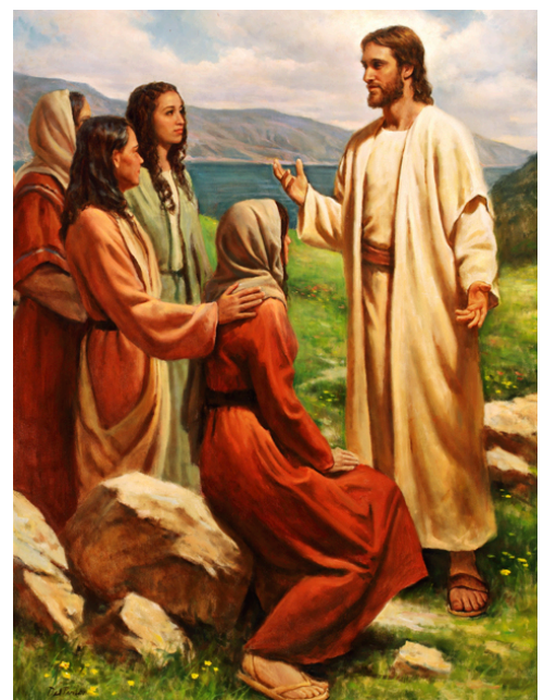
Gesù e le discepole