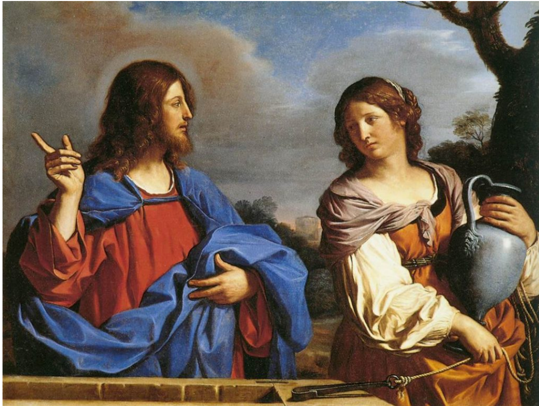
Gesù e la Samaritana

L'apostolo poi parla dei doni spirituale in 1 Corinzi 12 . Da notare che “la parola di sapienza, la parola di conoscenza, parlare in lingue e l'interpretazione” tutti richiedono il PARLARE, parlare in chiesa, e parlare è per tutti, entrambi uomini e donne. “Ma tutte queste cose le opera quell'unico e medesimo Spirito, distribuendo i doni a CIASCUNO in particolare come vuole” sia maschi che femmine. (v11)