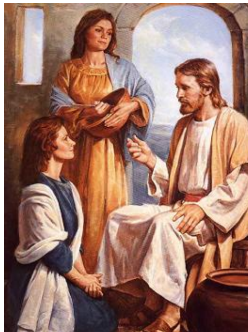
Gesù con Marta e Maria

Tuttavia, Gesù non pensava al ruolo delle donne in termini così ristretti, non