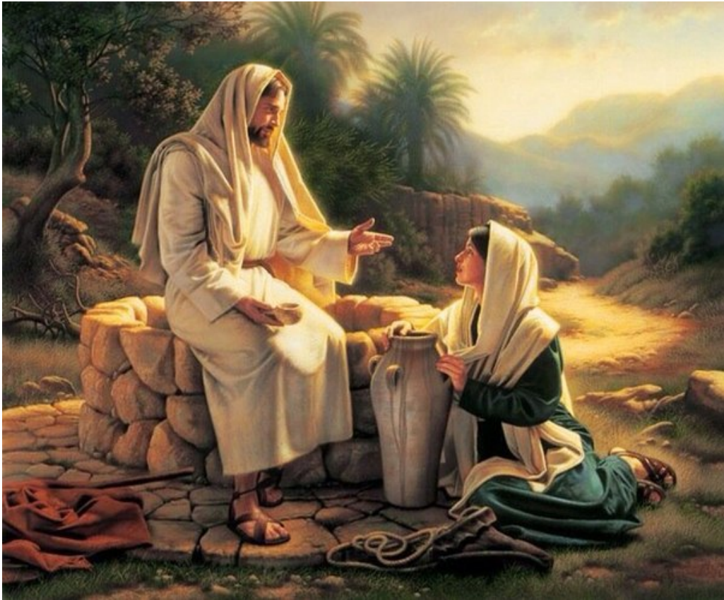
Gesù e la Samaritana

Proprio come quando Gesù si è rivelato a Marta e Maria durante la resurrezione di Lazzaro, Gesù si rivela qui in uno dei suoi ruoli chiave, il Messia ( Giovanni 4:25 ) ad una donna che immediatamente rese testimonianza agli abitanti di un villaggio. È interessante notare inoltre che, apparentemente, la testimonianza di donne ha un maggior peso tra i Samaritani che non tra gli ebrei. Molti Samaritani di quella città cedettero in Lui per la forza della testimonianza della donna. Sembra che Giovanni, nel suo Vangelo, abbia voluto rafforzare l'idea di dignità e la considerazione che Gesù aveva per le donne, ponendole sempre in un primo piano per quanto riguarda l'annuncio della salvezza.