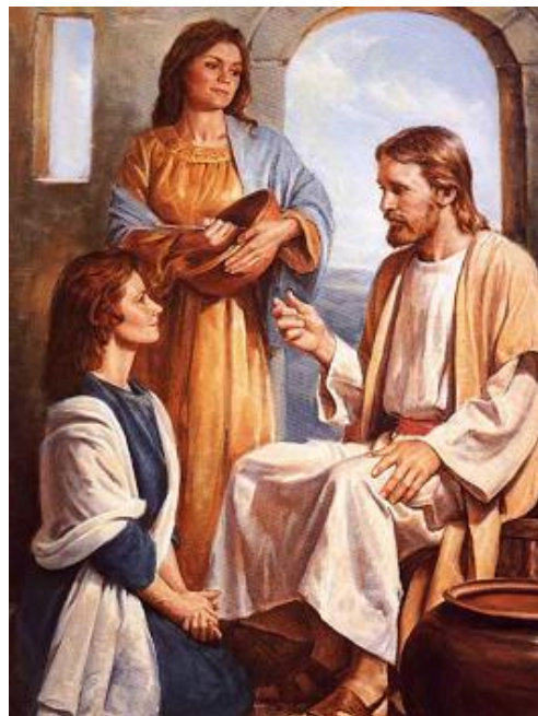
Gesù con Marta e Maria

Tuttavia, Gesù non pensava al ruolo delle donne in termini così ristretti, non